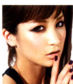
黒田エイミ モデル