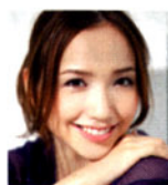
豊田エリー 女優、モデル

1. 抗酸化作用が高く、腐敗しにくいホホバオイルは安全性も高く人工心臓の潤滑油として使われるほど。ビタミン、ミネラルが豊富な100%オーガニックで、クレンジングから保湿、髪の手入れまでこれ1本でOK。ホホバオイル[50ml] ¥4,700 / Pro Bio(ナチュラルオーケストラ) 2. ビタミンCやポリフェノールを多く含むエルダーフラワーが肌を一段明るくし、シミや日焼けの気になる季節の美白ケアにも。クリーム EL[40ml] ¥7,035 / Jurlique(ジュリーク・ジャパン)